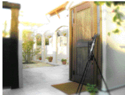
スタッフが丹精こめて手入れをする中庭は、心休まる癒しの園