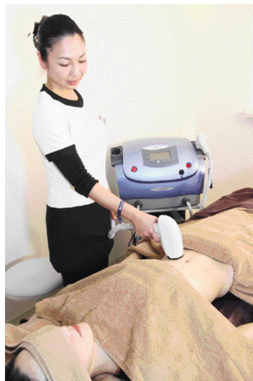
わずか3～6回でシワ・たるみ・脂肪をもすっきりさせるサーモシェイプは、世界45カ国で実績のある安心で確実なトリートメント。同サロンではいち早く導入している