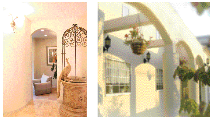
南仏のプライベートホテルに滞在するような優雅な気分で贅沢なひと時を