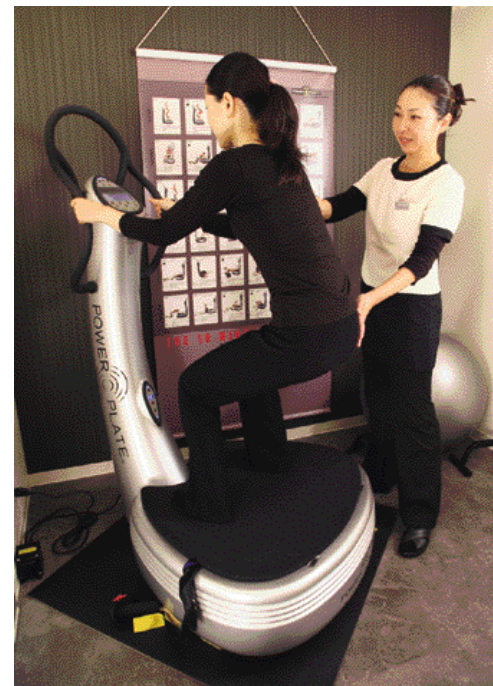
何とたった10分で約1時間分のトレーニング効果が見込めるというパワープレートが体験できるのは、県内では同サロンのみ